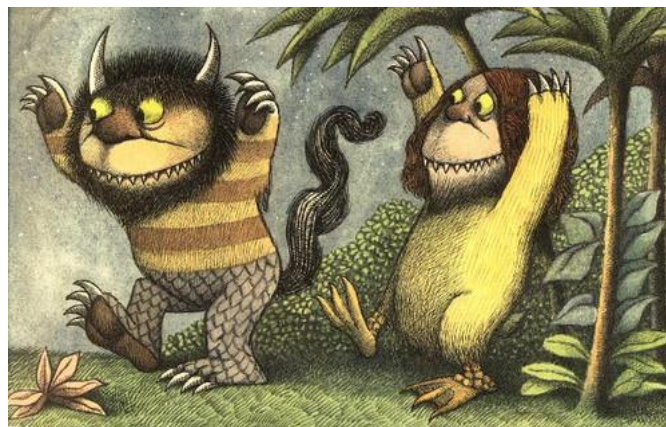
تصویر شماره‌ی ۲

وحشی بودن به خود گرفته‌اند شکل وارونه‌ی آنچه متن گفته‌است را نشان می‌دهد (تصویر شماره‌ی ۲).