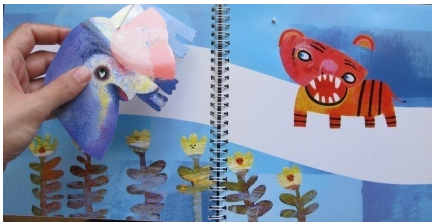
تصویر شماره‌ی ۶

۶-۳-۱۴. همین و همان: این شگرد در واقع برگرفته از نام کتاب همین و همان است. تصویرها در همان حال که خود به تنهایی معنادارند، می‌توانند با ورق خوردن یک صفحه، بخشی از تصویر صفحه‌ی پسین را نیز کامل کنند. این شگرد بیننده را وامی‌دارد تا به جای تمرکز بر یک تصویر، به دو تصویر توجه کند و با مقایسه‌ی پی‌درپی تصویرها، تفاوت‌ها و شباهت‌های‌شان را از یکدیگر باز شناسد. برای نمونه در یکی از بخش‌های کتاب همین و همان ابتدا تصویر گوزنی از نمای نزدیک دیده می‌شود؛ ولی با ورق خوردن نیمه‌ی پایینی، تصویر همان گوزن این‌بار از نمای دورتر و در میان شاخ و برگ درختان ظاهر می‌شود (تصویر شماره‌ی ۷).