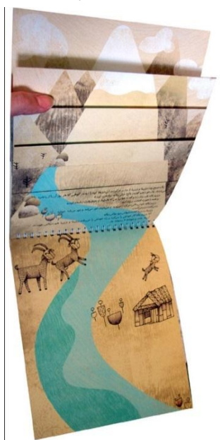
تصویر شماره‌ی ۵

۶-۳-۱۲. برش‌های پله‌ای: در شگرد برش‌های پله‌ای هم‌اندازه‌نبودن صفحه‌های داخلی کتاب و به گونه‌ای پله‌ای بودن آن‌ها موجب می‌شود کودک از هر صفحه تنها بخشی را ببیند و تلاش کند بخش مخفی شده را حدس بزند. این عمل سبب می‌شود او میان تمرکز بر یک بخش و حدس‌زدن درباره‌ی بخش نادیدنی نوسان کند. برش‌های پله‌ای در یواش برو، یواش بیا مشاهده شد (تصویر شماره‌ی ۵).