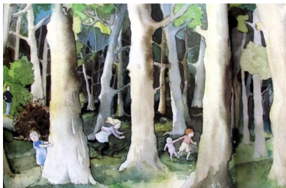
تصویر شماره‌ی ۳

۶-۳-۸. شوخی تصویری: به این معنا که یک تصویر به گونه‌ای دو پهلو به کار گرفته شود. به طوری که بیننده ابتدا به اشتباه بیفتد و آنچه را که منظور اصلی روایت است در نیابد؛ ولی با کمی دقت پی به خطای خود برد. از راه این شگرد بیننده از تمرکز بر دریافت نخست خود خارج شده، این‌بار تصویر را از زاویه‌ای دیگر می‌نگرد. در می‌خواهیم یه خرس شکار کنیم، هنگامی که بچه‌ها به جنگل می‌رسند، فضای ترسناک حاکم بر جنگل، آن‌ها را در حالتی از بهت و نگرانی فرو می‌برد. پشت سر یکی از دخترها تنه‌ی درختی روی زمین افتاده‌است، به گونه‌ای که ریشه‌های قهوه‌ای رنگش قسمتی از فضای پشت سر دختر را در بر گرفته‌است. از آنجا که رنگ ریشه‌ی درخت هم‌رنگ موهای دختر است بیننده دچار خطا می‌شود و ریشه‌ی درخت را به جای موهای دختر فرض می‌کند. اگر بیننده دقت بیشتری کند متوجه اشتباه خود خواهد شد و به این ترتیب از دریافت نخست خویش فاصله می‌گیرد (تصویر شماره‌ی ۳).