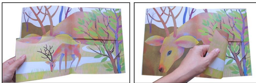
تصویر شماره‌ی ۷

۶-۳-۱۴. همین و همان: این شگرد در واقع برگرفته از نام کتاب همین و همان است. تصویرها در همان حال که خود به تنهایی معنادارند، می‌توانند با ورق خوردن یک صفحه، بخشی از تصویر صفحه‌ی پسین را نیز کامل کنند. این شگرد بیننده را وامی‌دارد تا به جای تمرکز بر یک تصویر، به دو تصویر توجه کند و با مقایسه‌ی پی‌درپی تصویرها، تفاوت‌ها و شباهت‌های‌شان را از یکدیگر باز شناسد. برای نمونه در یکی از بخش‌های کتاب همین و همان ابتدا تصویر گوزنی از نمای نزدیک دیده می‌شود؛ ولی با ورق خوردن نیمه‌ی پایینی، تصویر همان گوزن این‌بار از نمای دورتر و در میان شاخ و برگ درختان ظاهر می‌شود (تصویر شماره‌ی ۷).