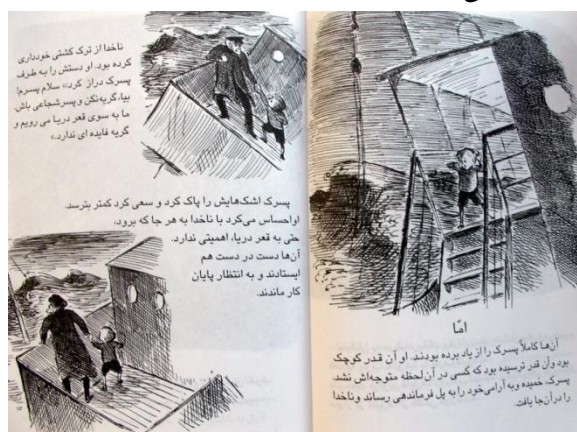
تصویر شماره‌ی ۱

۶-۱-۶. تعادل و ناتعادلی: ناتعادلی در تصویر از راه تأثیر پنهان عنصرهای تجسمی به وجود می‌آید. خط مورب حالت‌هایی چون تحرک، پویایی، خشونت و بی‌سکونی را نشان می‌دهد (حسینی‌راد، ۱۳۸۳: ۲۶). در واقع تعادل و ایستایی تصویری از راه خط‌های افقی و عمودی و نایستایی از راه خط‌های مورب نشان داده می‌شوند. در پسرک و ناخدای شجاع آشفتگی اوضاع در لحظه‌ای که کاپیتان و پسرک تلاش می‌کنند راهی برای فرار از کشتی در حال غرق‌شدن پیدا کنند با ترسیم تصویرها و خط‌های مورب نشان داده شده‌است (تصویر شماره‌ی ۱). این در حالی است که پیش از این، تصویرها با خط‌های افقی و عمودی سامان یافته بودند که به شکلی آرامش موجود در کشتی و یا ساحل را نشان می‌دادند.